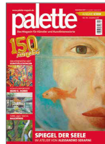
Titelbild Alessandro Serafini: o. T., 2006, Öl auf Hart- faserplatte, Leinwand, Mischtechnik, 90 x 100 cm