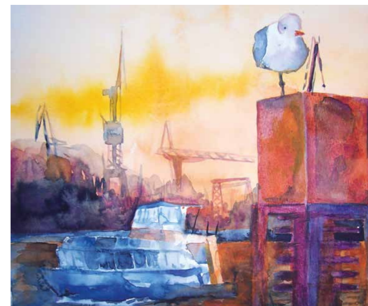
ab Seite 76