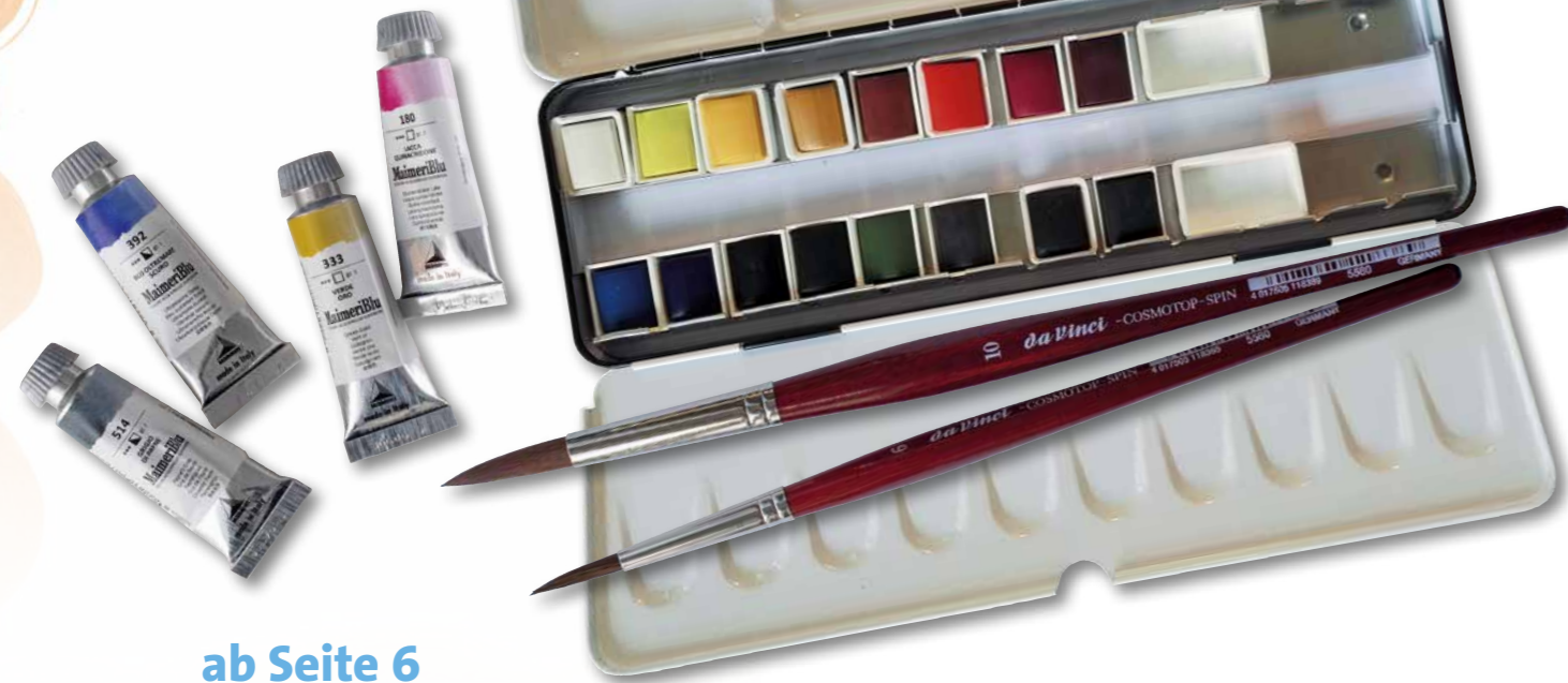
ab Seite 6